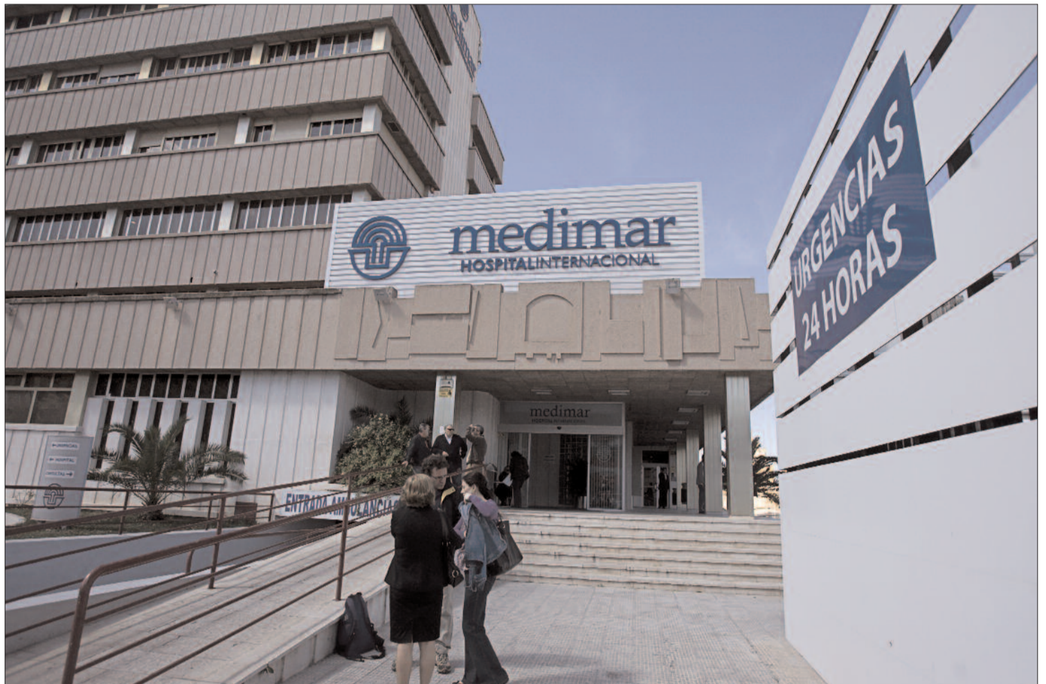
Desde hace más de 25 años es uno de los centros sanitarios privados más punteros de nuestro país. JAVI MARÍN

«Se busca recuperar para nuestros pacientes la sensación de confianza, seguridad y proximidad